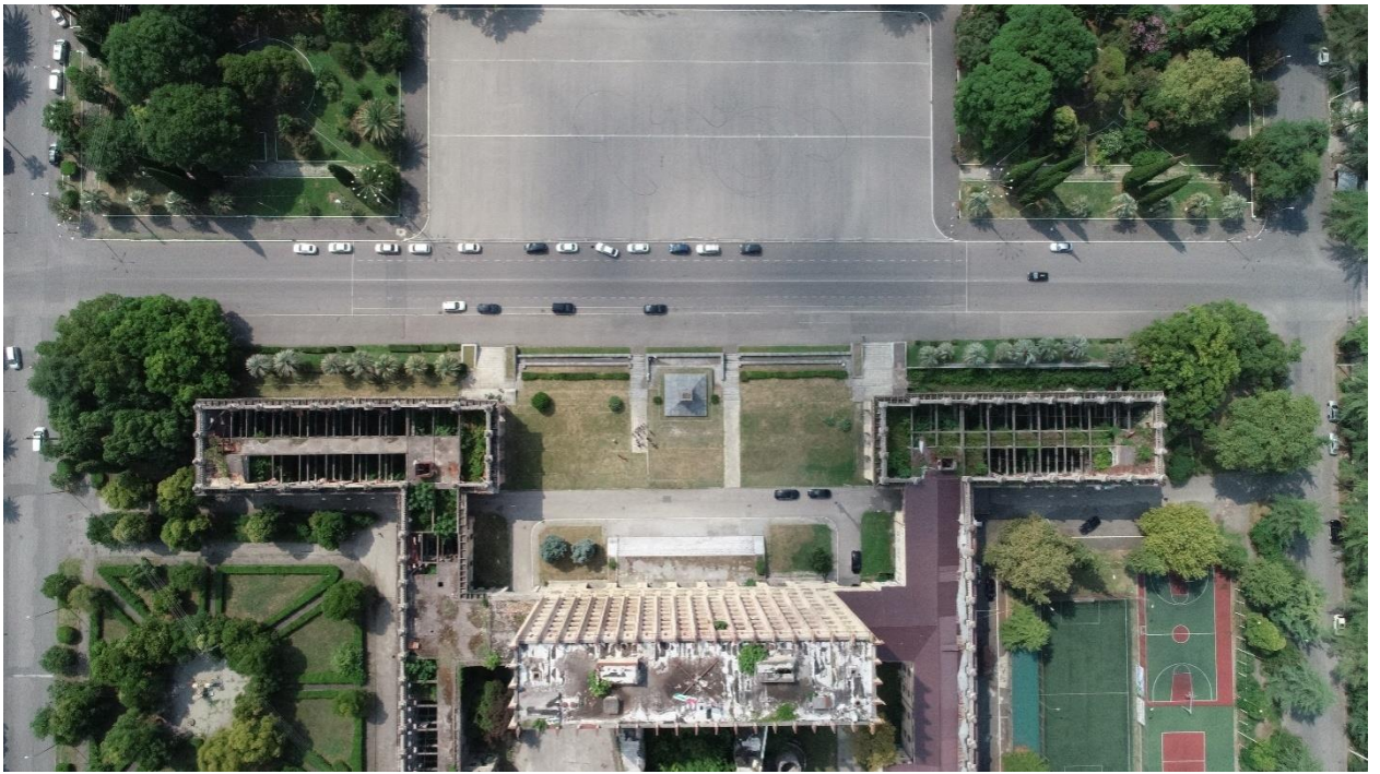
Вид на место установки памятника с высоты птичьего полета

На сегодняшний день площадь является местом проведения крупных государственных праздников, таких как парады в честь Дня Победы в Отечественной войне народа Абхазии 1992–1993 гг.